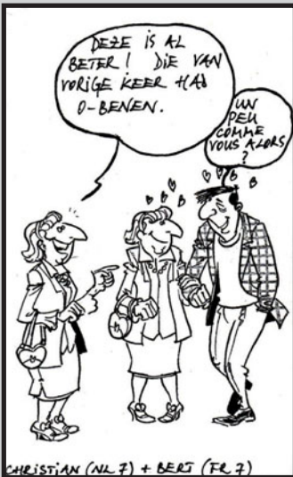
La petite bibliothèque grinçante: Les belles-mères. Chiflet & Cie. Illustration Duvigan