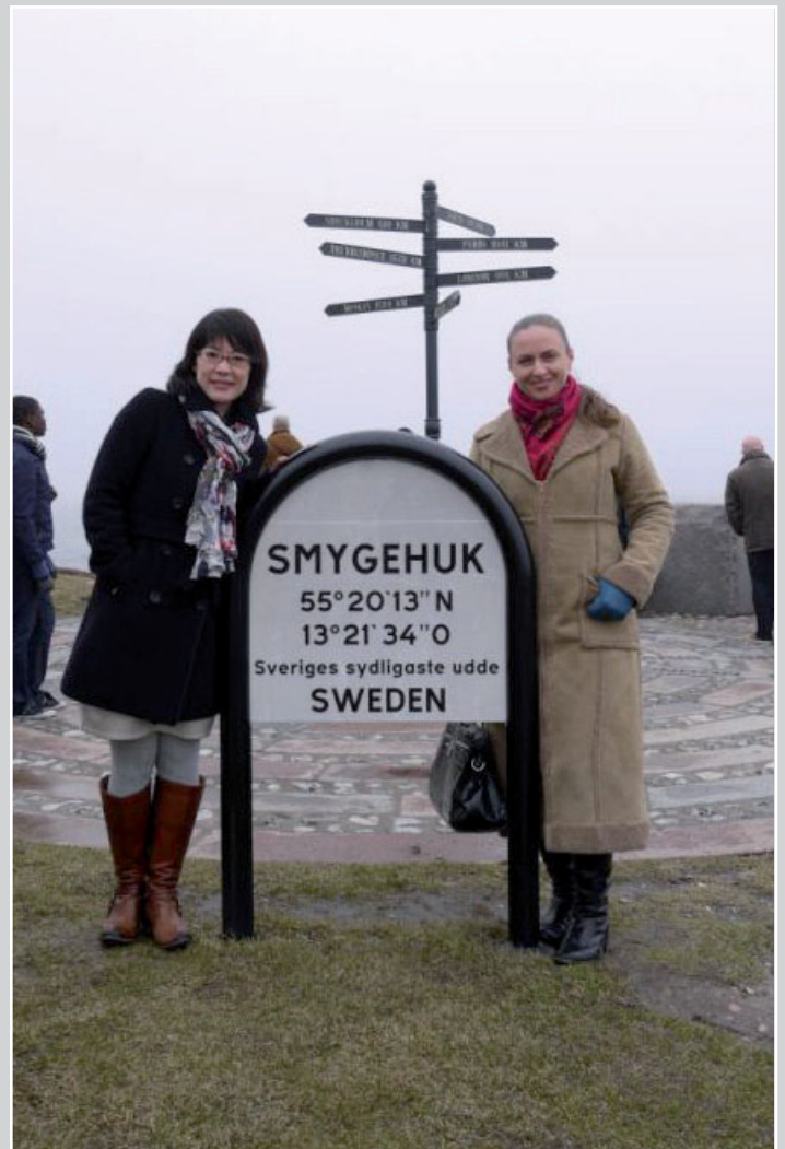
Interculturele ontmoeting in Zweden, zie blz. 7