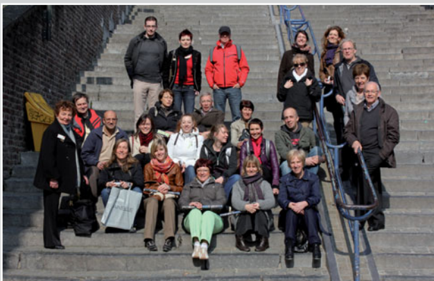
Fris en monter nèt voor de beklimming van de trappen van Bueren.