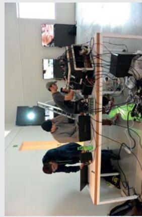
ONTWAR toont creaties van jongeren die hun grenzen hebben afgestapt in de digitale media. Wat begon als een educatieve

Ben je nieuwsgierig geworden naar ons werk? Het volgende evenement is ons filmfestival Buitenbeeld in Cinema Z op donderdag 26 juni om 20 uur. Dan tonen we de eindwerken van dit jaar.